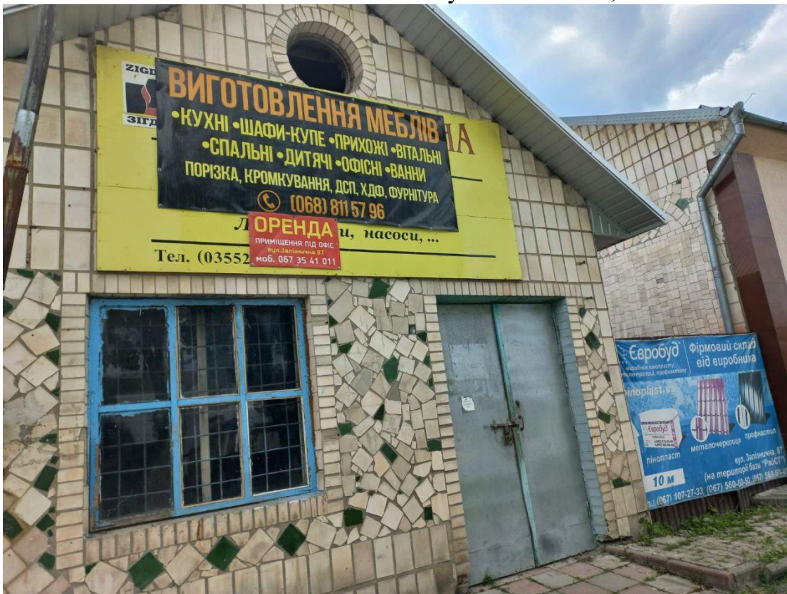
15. Незаконно встановлена вивіска по вул. Залізнична, 87