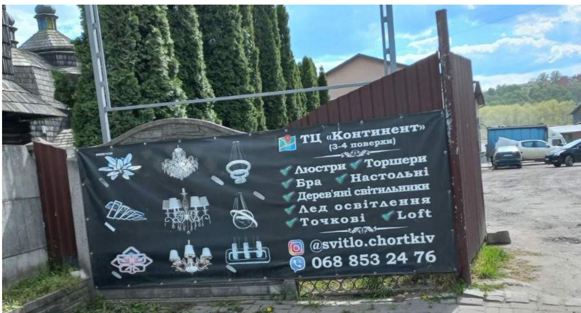
17. Незаконно встановлена вивіска по вул. Залізнична, 107