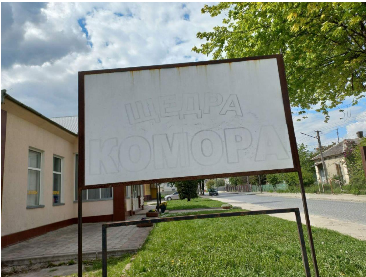
13. Незаконно встановлена вивіска по вул. Залізнична, 87